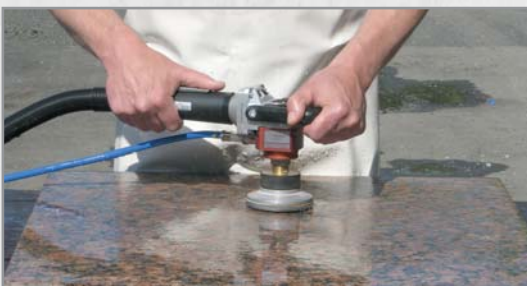
Bild: Einsatz in Verbindung mit GADIA ANTISHOCK zum vibrationsarmen Arbeiten.

Kugellagerung der Spindel im Spülkopf mit darunterliegenden Wasserdichtungen.